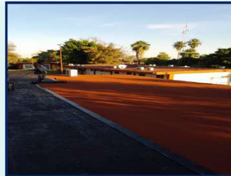
IMPERMEABILIZACIÓN DE 215.46 M 2 DE 1 EDIFICIO CON CARTÓN ARENADO