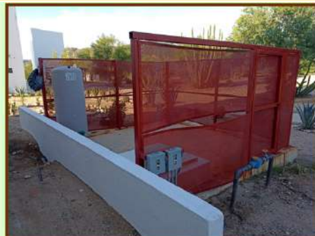
SE REALIZARON TRABAJOS DE MANTENIMIENTO A CISTERNA, ADECUACIÓN EN EL CAV COMO LO ES INSTALACIÓN DE UNA PUERTA Y 2 BASTIDORES, SELLADO DE CANCELERÍA Y RESANE EN MUROS DAÑADOS.