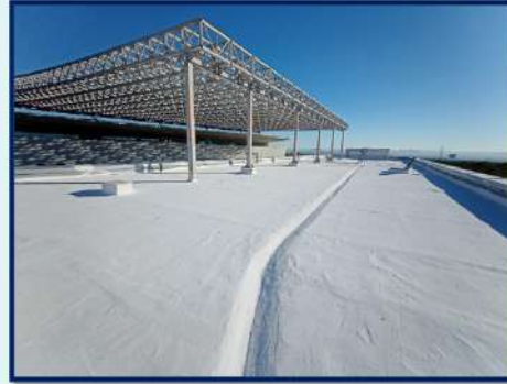
IMPERMEABILIZACIÓN DE 724.76 M 2 EN 1 EDIFICIO Y 7 ÁREAS ESPECIFICAS CON ELASTOMÉTICO