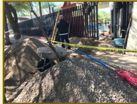
CONSTRUCCIÓN DE MÓDULO DE BAÑOS