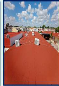
IMPERMEABILIZACIÓN DE 686.9 M 2 DE 4 EDIFICIOS CON CARTÓN ARENADO