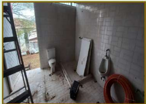
SE REALIZAN TRABAJOS DE INSTALACIÓN DE LUMINARIAS Y REHABILITACIÓN DE BAÑOS EN CONDICIÓN DE ABANDONO.