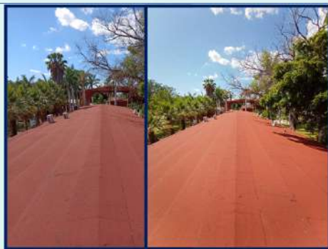
IMPERMEABILIZACIÓN DE 1 352.67 M 2 EN 3 EDIFICIOS CON CARTON ARENADO Y 2 CON ELASTOMERICO DANDO UN TOTAL DE