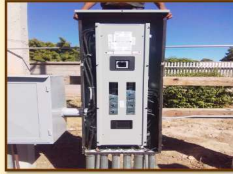
TRABAJOS ELÉCTRICOS PARA LOGRAR EL CORRECTO ABASTECIMIENTO EN LOS EDIFICIOS DE LA UNIDAD ACADÉMICA.