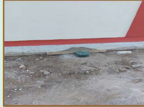
REHABILITACIÓN DE TUBERÍAS TAPONADAS CON RAÍCES Y SUSTITUCIÓN DE UN ÁREA DE PISO DAÑADA EN UN AULA.