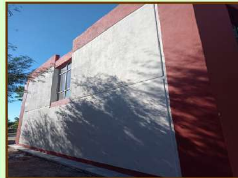
ENJARRE EN MURO DEL EDIFICIO B, IMPERMEABILIZACIÓN DE UNA SECCIÓN, COLOCACIÓN DE SOPORTE DE MINI SPLIT