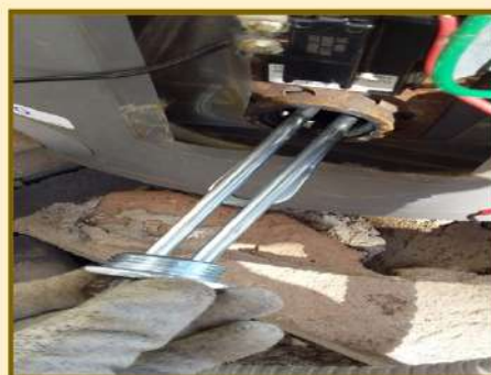
TRABAJOS DE SUSTITUCIÓN DE RESISTENCIAS Y ADECUACIONES EN RED HIDRÁULICA EN BOILERS POR PROBLEMAS EN ENFRIAMIENTO.