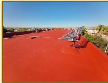
TRABAJOS DE IMPERMEABILIZACIÓN Y ENJARRE EN MUROS DE PRETEL PARA SOLUCIONAR LAS FILTRACIONES