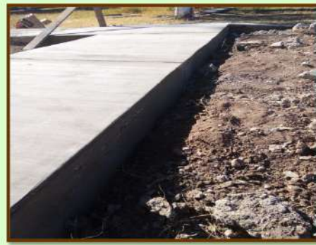
TRABAJOS DE REHABILITACIÓN DE ANDADORES DERIVADO DE DIVERSOS ACCIDENTES CON LA POBLACIÓN ESTUDIANTIL Y ACADÉMICA