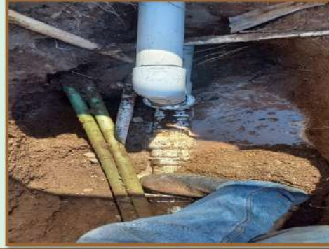
TRABAJOS DE MANTENIMIENTO A RED HIDRÁULICA DAÑADA EN ÁREA DE CISTERNA