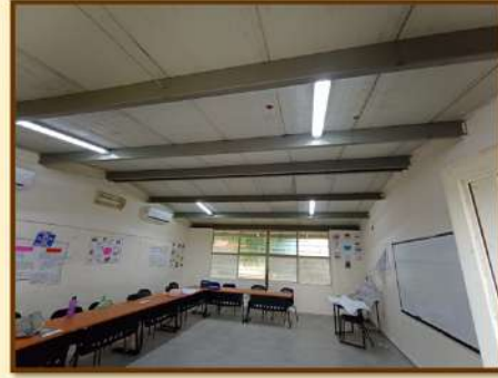
SE REALIZARON TRABAJOS DE INSTALACIÓN DE YITROPISO EN 5 MÓDULOS DE AULAS Y ADECUACIONES ELÉCTRICAS EN UNA DE ELLAS, DE IGUAL MANERA SE REHABILITÓ EL CERCO PERIMETRAL.