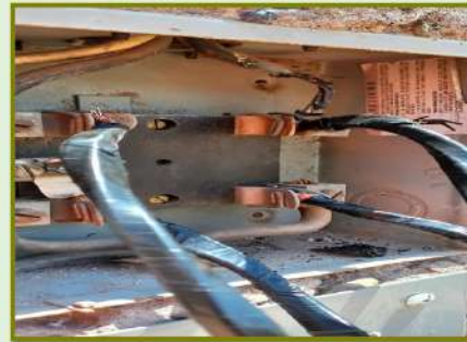
REPARACIÓN ELÉCTRICA DEL CORTO OCURRIDO EN LA MUFA, SUSTITUCIÓN DE LA BASE DE MEDICIÓN Y RECABLEO DE TRAMO